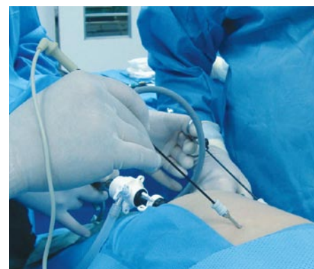
Cirugía mini laparoscópica.

La Cirugía Mini Laparoscópica es la otra alternativa que busca minimizar los efectos de la Cirugía de Invasión Mínima, en su nacimiento durante los últimos años de la década pasada se le llamó Cirugía Acuscópica, que significaba Cirugía por Agujas, el objetivo de la misma es minimizar los accesos y disminuir el tamaño de las heridas operatorias. Al igual que la Cirugía Laparoscópica mantiene la misma técnica quirúrgica que revolucionó los inicios de la misma hace ya dos décadas.