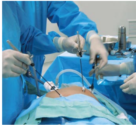
Cirugía Mini Laparoscópica es mas ergonomica.

Por lo que una vez recibido el entrenamiento necesario para usar adecuadamente estos instrumentos cualquier cirujano experto en Cirugía Laparoscópica Convencional podría hacer Cirugía Laparoscópica Mini, sin necesidad de cambiar su técnica quirúrgica. El uso adecuado de estos instrumentos entonces da mejores resultados en cuanto a dolor y a efecto estético, asociado a que estos son completamente reusables y esto disminuye los costos de los procedimientos considerablemente haciéndoles más accesibles a un mayor número de pacientes. Por otro lado por ser una cirugía que tiene al menos 50% menos dolor, que la laparoscopia normal; esta disminuye la estancia hospitalaria y facilita el retorno temprano a las labores normales de los pacientes.